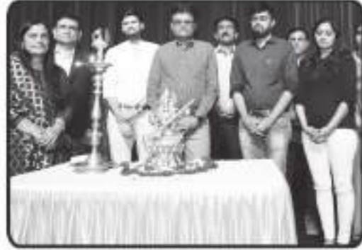
મહાનુભવો દ્વારા દિવ પ્રાગટ્ય