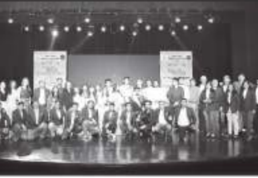
ફાયનાલીસ્ટ, જજ અને ટીમ SVGA