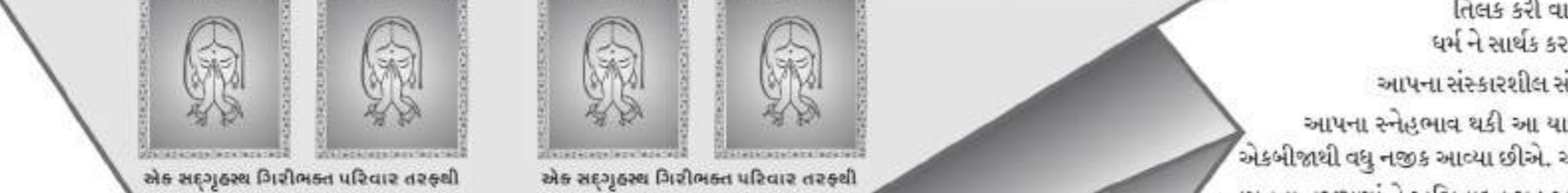
એક સદ્ગુણ્ય ગિરીભક્ત પરિવાર તરફથી એક સદ્ગુણ્ય ગિરીભક્ત પરિવાર તરફથી

લી.: શ્રી રજસ્થાનના ગોડવાડ ક્ષેત્ર ભાગ - ૩ ના પ્રાચિન તિર્થોની યાત્રા પ્રવાસના સર્વ પૂણ્યશાળ ચાત્રીક ગણવતી.