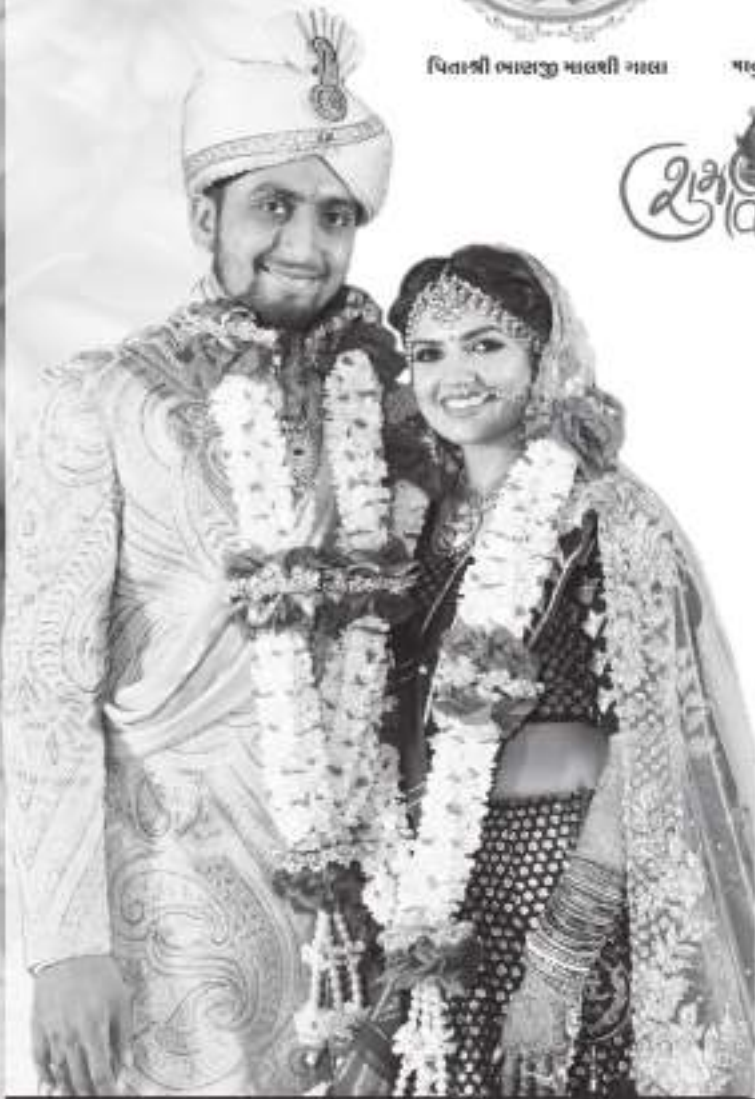
ચિ. રાજ સંગે ચિ. ઝીલ