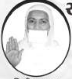
દિક્ષીત બા.બ. પૂ. રૂપતાકુમારી મ.સ.

સ્થાપના : સં. ૨૦૧૦ ટ્રસ્ટ રજી. નં. ૯-૫૩ (ભુજ-કચ્છ)